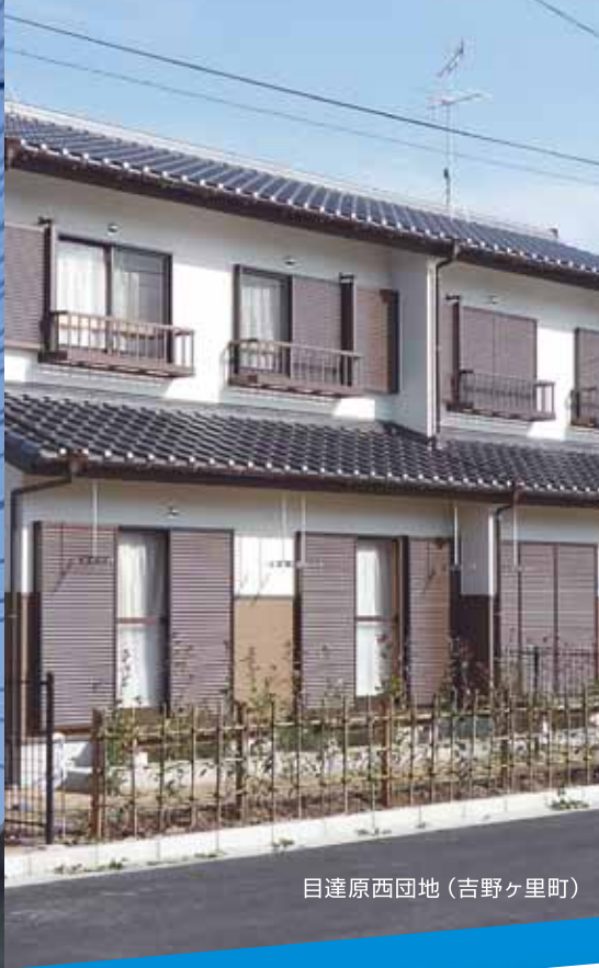
目達原西団地 (吉野ヶ里町)