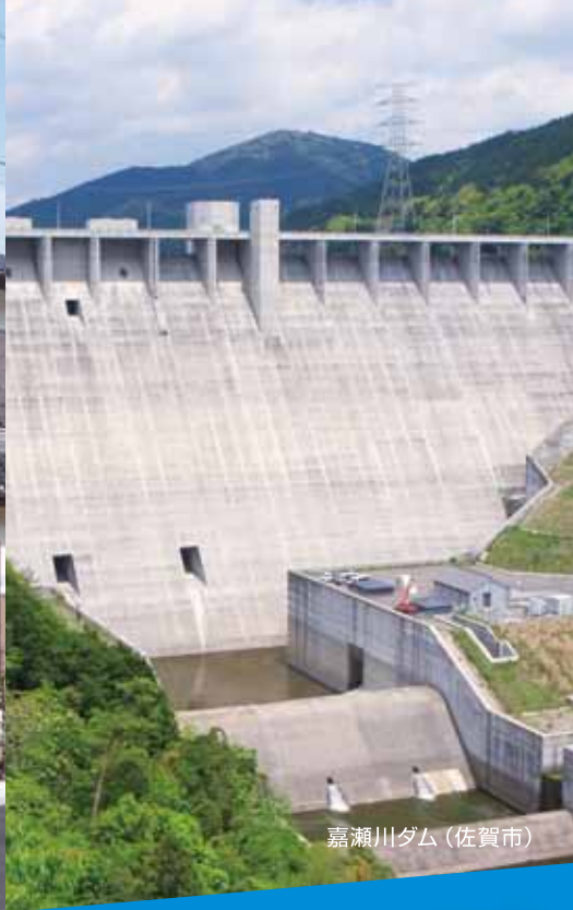
嘉瀬川ダム (佐賀市)